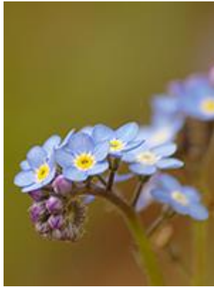
Skov-forglemmingej ( Myosotis sylvatica ) Blomstrer maj-juni