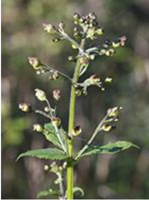
Knoldet brunrod ( Scrophularia nodosa ) Blomstrer juni-august