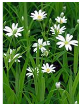
Stor fladstjerne ( Stellaria holostea ) Blomstrer maj-juni