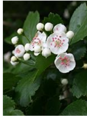
Alm. hvidtjørn ( Crataegus laevigata ) Blomstrer maj-juni