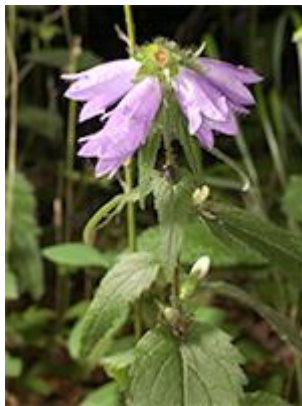
Nælde-klokke ( Campanula trachelium ) Blomstrer juli-august