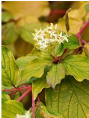
Rød kornel ( Cornus sanguinea ) Blomstrer juni-juli