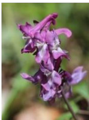
Hulrodet lærkespore ( Corydalis cava ) Blomstrer April-juni