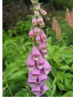
Almindelig fingerbøl ( Digitalis purpurea ) Blomstrer juni-august