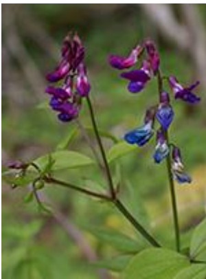
Vår-fladbælg ( Lathyrus vernus ) Blomstrer maj-juni