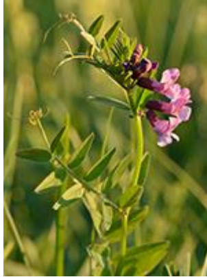
Gærde-vikke ( Vicia sepium ) Blomstrer juni-august