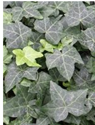
Vedbend ( Hedera helix ) Blomstrer sep.-nov.