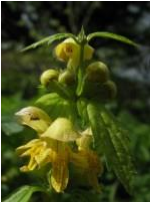
Almindelig Guldnælde ( Lamium galeobdolon ) Blomstrer maj-juni