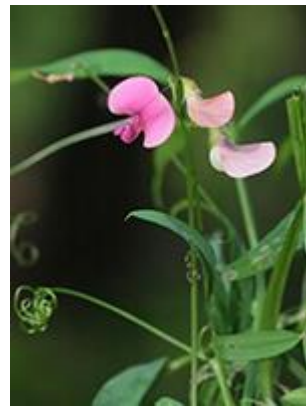
Skov-fladbælg ( Lathyrus sylvestris ) Blomstrer juli-august