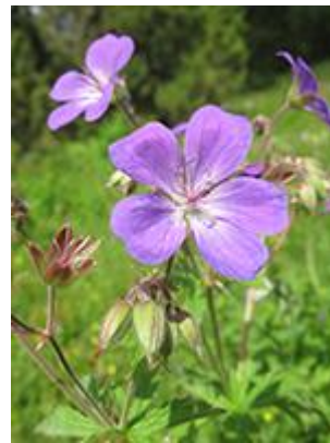
Skov-storkenæb ( Geranium sylvaticum ) Blomstrer maj-juli