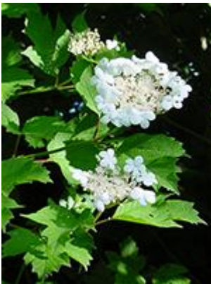
Kvælkved ( Viburnum opulus ) Blomstrer juni