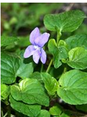
Krat-viol ( Viola riviniana ) Blomstrer april-juni