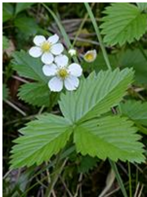
Skov-jordbær ( Fragaria vesca ) Blomstrer maj-juli