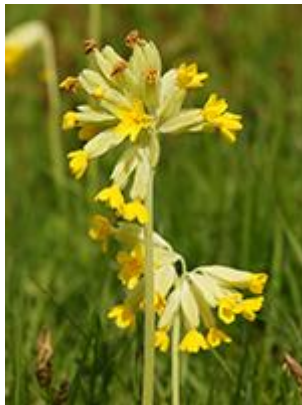
Hulkravet kodriver ( Primula veris ) Blomstrer April-maj