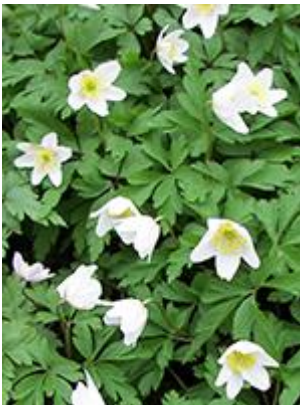
Hvid anemone ( Anemone nemorosa ) Blomstrer April-maj