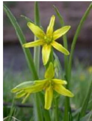
Almindelig guldstjerne ( Gagea lutea ) Blomstrer April-maj