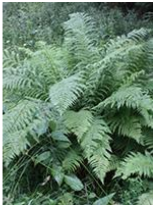
Almindelig Mangeløv ( Dryopteris filix-mas ) Blomstrer juli-september