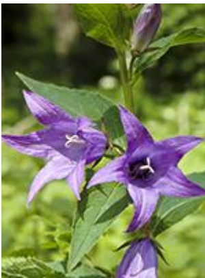
Bredbladet klokke ( Campanula latifolia ) Blomstrer juli-august