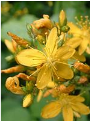
Lådden perikon ( Hypericum hirsutum ) Blomstrer juli-september